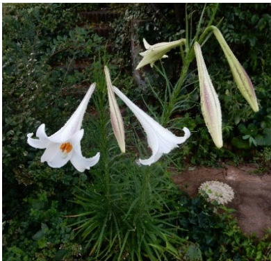
「タカサゴユリ」特徴の薄紫色の筋が見える。 (近所の庭先 8/25)

そして、両者を区別する最も肝心な部分が花弁の外側に入る薄紫色の筋が「タカサゴ」にあり、「テッポウ」にはない。ところが、我が家の百合にはその薄紫色の筋がない。