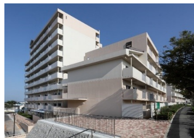
県営明石松ヶ丘 建替事業(第5期)