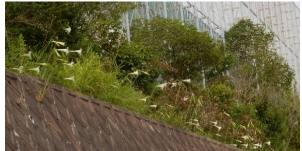
北区広陵中学校の外周に混合して咲く「タカサゴユリ」と「シンテッポウユリ」(8/25)

※2 「タカサゴユリは連作障害が出やすく、数年経つと姿を消すことが多い。種子が風で運ばれ新たな土地で生育して勢力を拡げる。」との説明がある。