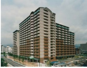
[マンションタイプ] アメニティコート西宮北口