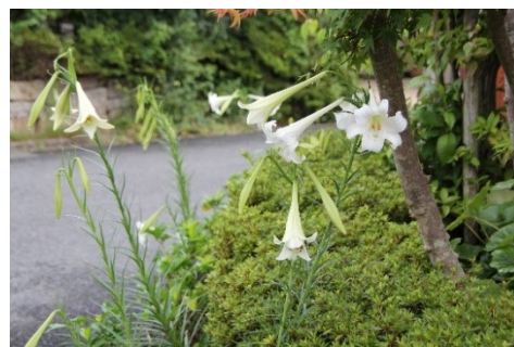
「シンテッポウユリ」 (近所の庭先 8/25)

我が家の駐車場脇（表紙）に5～6年前から白い百合が咲くようになった。どこかから種子が飛んできたんだろう。暑い夏に爽やかさを装ってくれるので重宝に感じているものの、手入れをしてもやるわけでもないのに、健気に毎年芽を出し、お盆が近づくと大輪の花を咲かせてくれる。