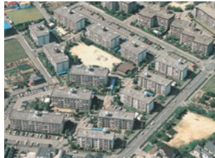
[団地型] 宝塚安倉団地