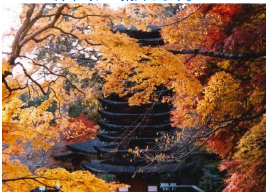
談山神社・紅葉と十三重の塔