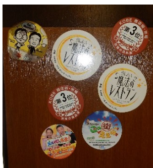
上：取材各局のシールの数々 右：六條商店・懐かしの駄菓子群

向かい側に店を構える「六條商店」とともに遠い昭和の記憶を呼びさまして頂けたら幸いである。