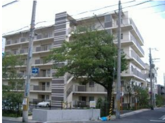
[マンションタイプ] アメニティコート岡本