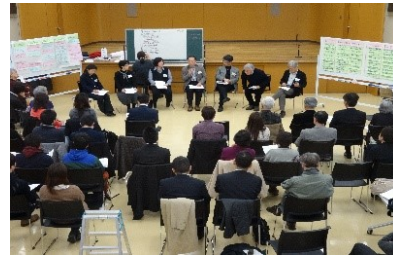
地元住民による明舞団地再生の話し合い