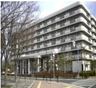
パストラル加古川